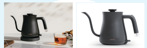
バルミューダ BALMUDA The POT