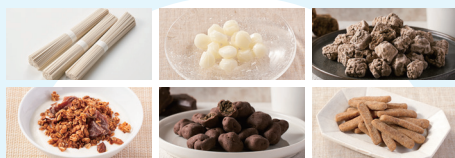
アップサイクルフードセット