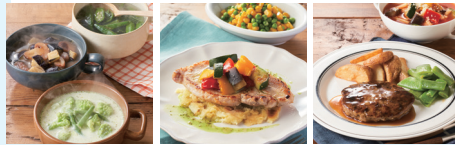
フードロス削減に貢献 ミールキット3種