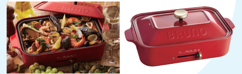
BRUNO コンパクトホットプレート