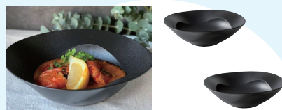
ARAS(エイラス) 深鉢ミル 2枚セット