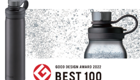
TIGER 真空断熱炭酸ボトル